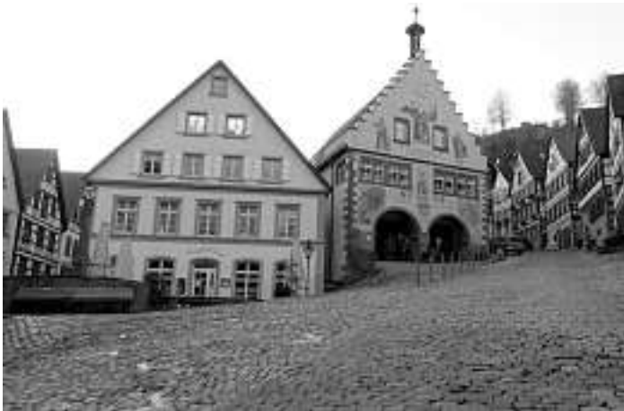
Ein Bild mit enormen Seltenheitswert – ein autofreier Marktplatz in Schiltach!

Für alle Dauerparker stehen genügend freie und kostenlose Parkmöglichkeiten ganz in der Nähe zur Innenstadt zur Verfügung, ob an der oberen Bahnhofsbrücke oder auf der Lehwiese oder entlang der Straße Am Hirschen - nur eine oder wenige Minuten und Schritte von der Innenstadt entfernt.