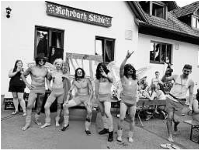
Der Sieg mit dem besten Kostüm ging dieses Jahr an das Team „Welschdorf Bräu“.