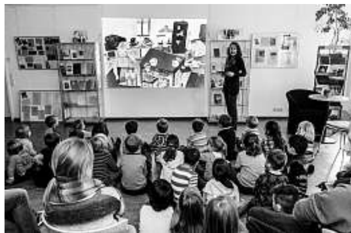
Neugierige Kinder hören der Geschichte zu und sehen sich die Bilder aus dem Buch an der Wand an.

Am Donnerstag, 11. Juli, findet das letzte Bilderbuchkino vor der Sommerpause in der Mediathek Schramberg statt. Dann verwandelt sich das Lesecafé wieder in ein kleines Kino: im Rahmen der monatlichen Bilderbuchkino-Reihe der Mediathek im City-Center wird die Geschichte „Leo, Dünen, Strand und mehr“ erzählt. Leo findet im Urlaub am Strand – gegen den Widerstand seiner Eltern – allerlei Dinge. Schließlich lädt er seine Eltern zu einer Schatzsuche mit einer selbst gezeichneten Karte ein, wobei sie ganz unerwartet am Ende sogar einen echten Schatz finden. Beginn des Bilderbuchkinos für Kinder ab 4 Jahren ist um 15 Uhr, der Eintritt ist frei.