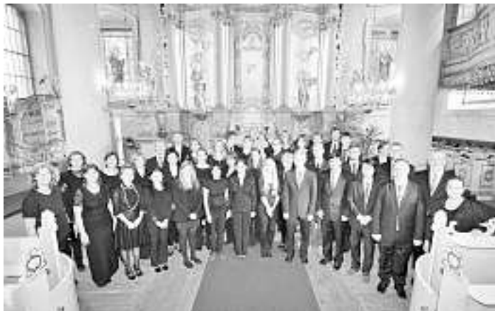
Der Chor der Hochschule für Kirchenmusik in der Trinitatiskirche zu Liepaja, Lettland