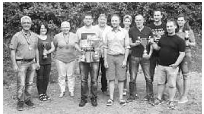
Sieger „Jedermann-Schießen 2018“