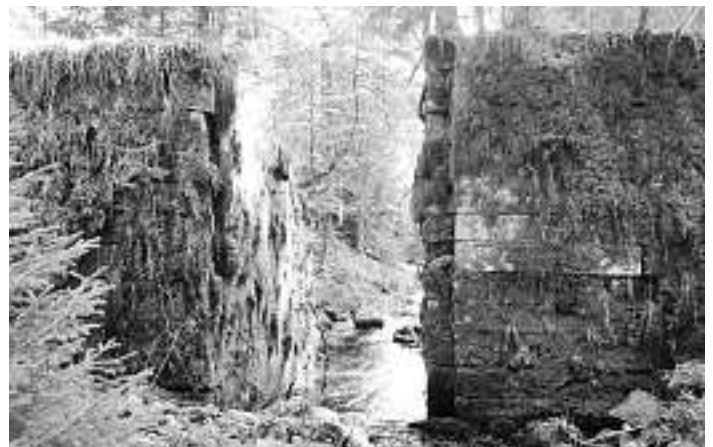
Schwallung Lay in Hinter-Kaltbrunn

Eingeladen zu diesem Informationsabend sind nicht nur die Schiltacher Flößer und die Mitglieder des Historischen Vereins Schiltach/Schenkenzell, sondern ausdrücklich die Bürgerschaft aus Schenkenzell und Schiltach sowie den angrenzenden Gemeinden, ebenso alle interessierten Gäste. Über eine rege Teilnahme würden wir uns freuen. (rm)