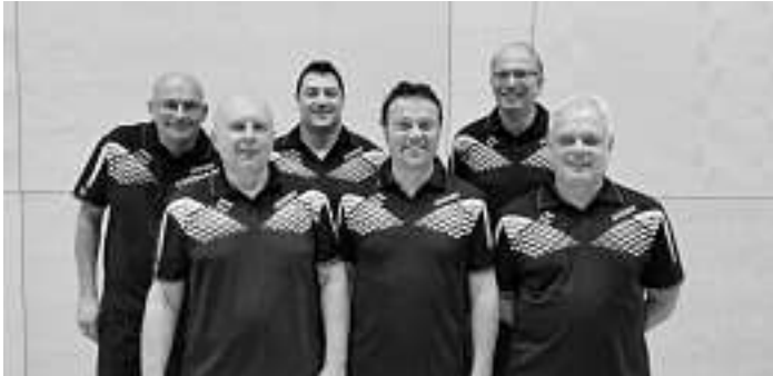
Die erste Mannschaft in Komplettbesetzung beim Rundenstart

Mit 14:18 Punkten konnte die A-Klasse zwar sportlich wieder gehalten werden, doch die Zukunft der Mannschaft sieht nicht rosig aus, weil drei der sechs Spieler aus unterschiedlichen Gründen der Mannschaft den Rücken kehren. Wenn keine Verstärkung gefunden wird, sieht die sportliche Zukunft des TTC Schiltach bescheiden aus, denn auch die Zweite Mannschaft leidet unter dem Personalverlust der ersten Mannschaft.