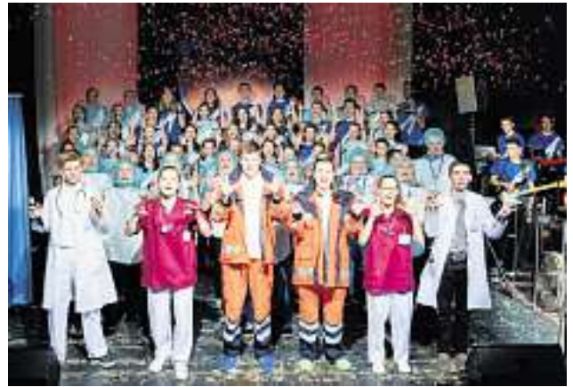
Veranstalter: CVJM Schiltach

Musical "Herzschlag" am 07. April 2018 um 18.30 Uhr in Schiltach in der Friedrich-Grohe-Halle Eintritt frei, Spenden werden erbeten