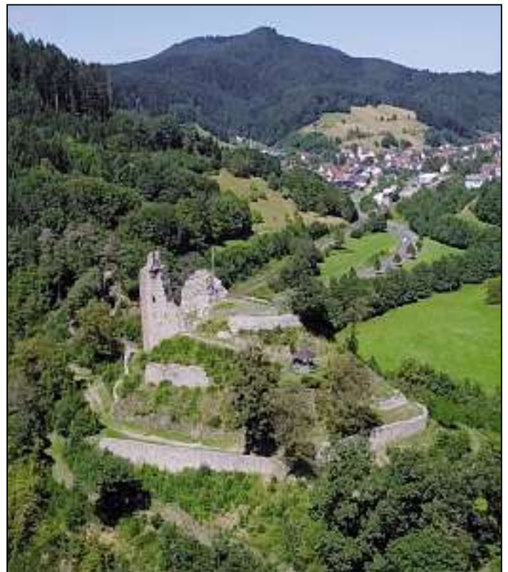
Themenweg Schenkenburg – siehe Innenteil –