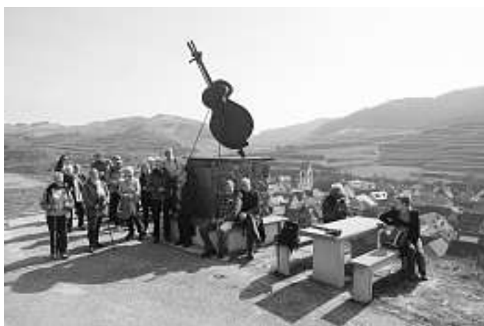
26.3.2018 Schwarzwaldverein Schiltach + Schenkenzell

Den Abschluss der Tour bildete die Wanderung auf dem Badberg-Pfad entlang des Krottenbaches, vorbei an den für dieses Weinbaugbiet typischen Häusern mit ihren schmucken Gärten und Vorhöfen zurück zum Ausgangspunkt.