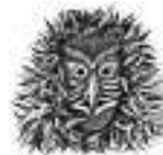
Schuhu-Hexen '86 Hinterlehengericht e.V.

EINLADUNG ZU DEM NACHBARSCHAFTSTREFFEN am 30. Januar 2018 um 19:30 im Gasthaus „Sonne“