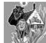
Narrenzunft Schiltach www.narrenzunft-schiltach.de

Am Samstag, den 3.02.2018 veranstalten die Schuhu Hexen und die Narrenzunft Schiltach ein Narrenerlebnis. Aufstellung für den Umzug um 13:30 Uhr an der ehemaligen Grundschule.